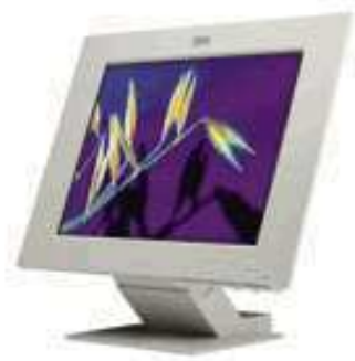
Slika 2: LCD ekran