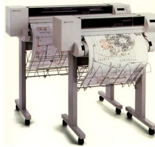
Slika 5: Ploteri