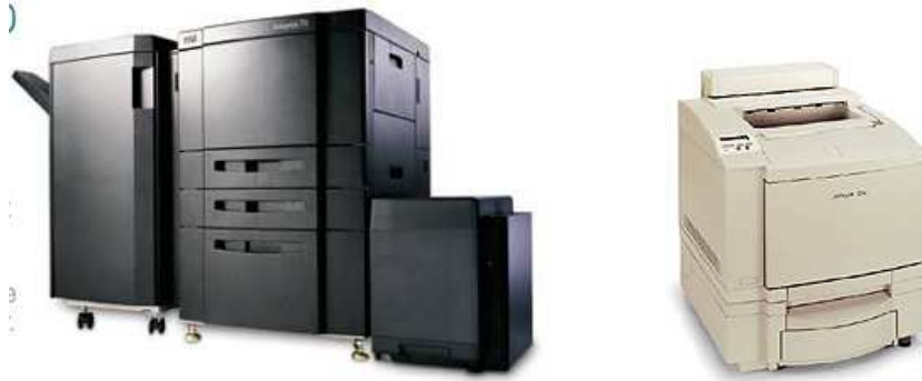
Slika 4: Laserski štampači