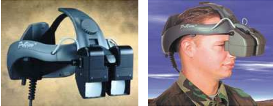
Slika 6: HMD ekrani