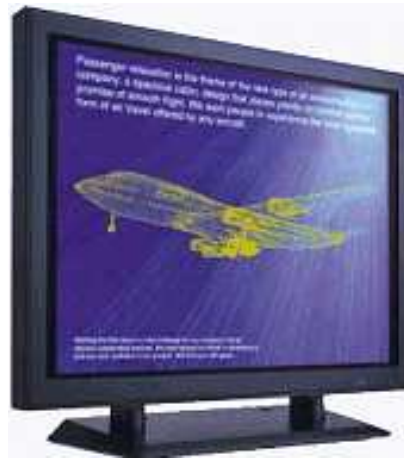
Slika 3: Gas-plazma ekran