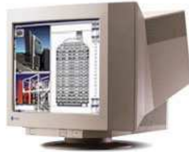
Slika 1: Izgled CRT ekrana i načina na koji formira sliku